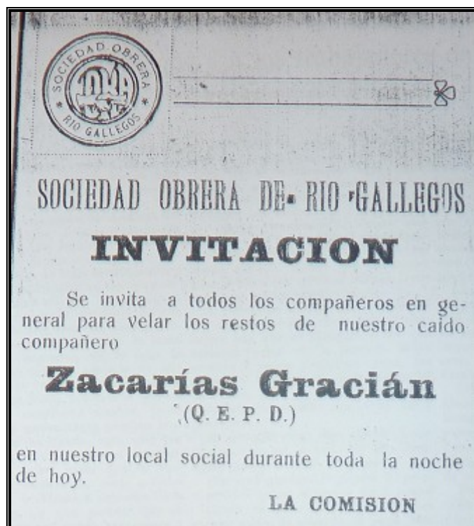
Folleto de la Sociedad Obrera, 21 de julio de 1921 (A.11).

En tensión con las figuraciones higienistas decimonónicas que asociaban las huelgas con una enfermedad y caracterizaban a los anarquistas con semas pertenecientes al campo de la criminología y de la salud 201 , adjudicando a sus doctrinas los epítetos de infección moral, de crímenes políticos y de patologías extrañas y con las construcciones de La Unión y El Nacional se invierte la antinomia y el mal que aqueja a los pueblos es el capitalismo defendido en las regiones australes por seres “monstruosos” como Correa Falcón y los grupos latifundistas.