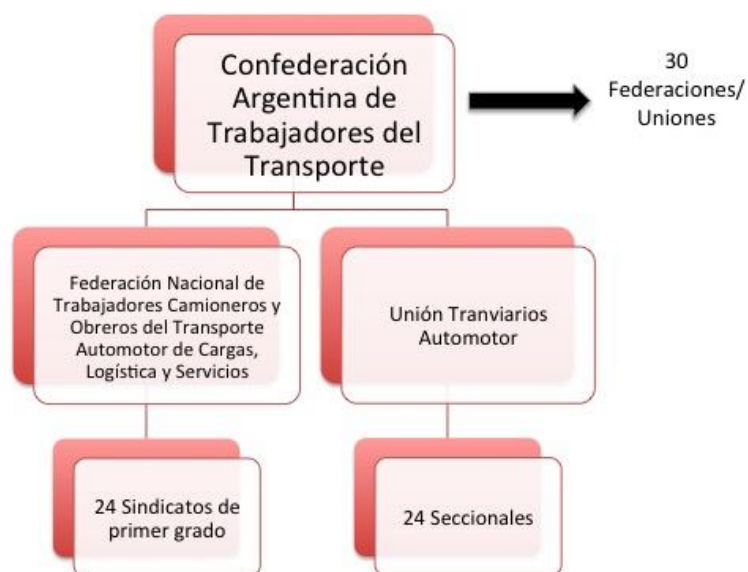
Figura N°1 : Estructura organizativa CATT, Camioneros y UTA.

Elaboración: Autora Fuente: Sitios web de las organizaciones