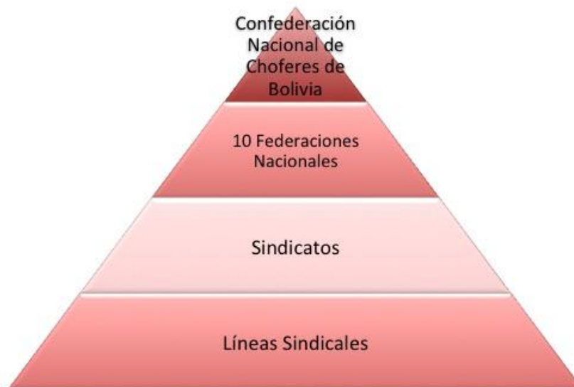
Figura N° 2. Estructura organizacional de la Confederación Nacional de Choferes de Bolivia.

hay un esquema de respeto en el sindicalismo del transporte. Los sindicatos no están subordinados a la Confederación pero sí dependen de las Federaciones Departamentales, hay respeto por los estatutos que son aprobados por todos, incluso las bases. Se respeta la jerarquía y hay elecciones internas, quienes tienen mayores posibilidades van a voto, tanto en las Federaciones como en la Confederación (entrevista código B2).